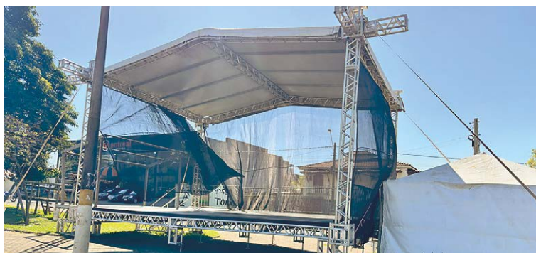
Palco já está montado para super carros, carros antigos e jogo da Copa

Além da exposição de automóveis antigos, o público poderá acompanhar bandas ao vivo e aproveitar espaço kids, praça de alimentação, food trucks e atrações para toda a família. Para os expositores, será solicitada a contribuição solidária de 2 quilos de alimentos não perecíveis ou R$ 20 por veículo.