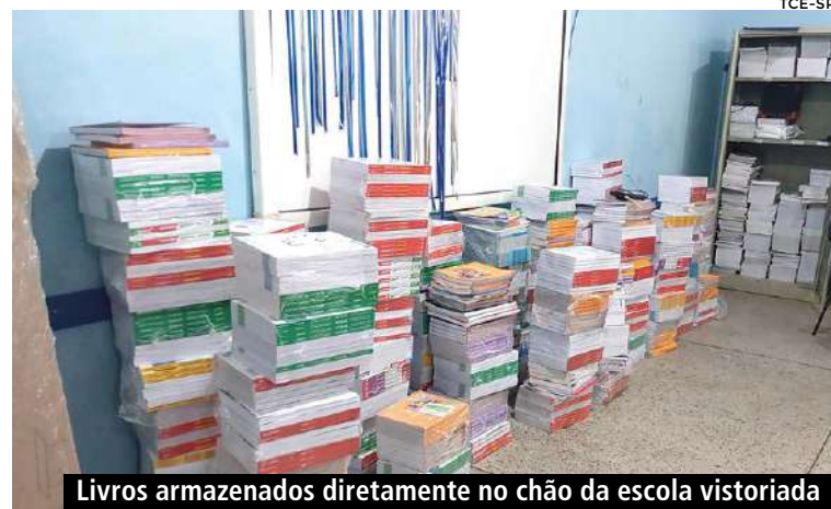
Livros armazenados diretamente no chão da escola vistoriada

A estrutura do depósito também apresenta problemas relacionados à segurança. O local não possui Auto de Vistoria do Corpo de Bombeiros (AVCB), não conta com plano de contingência e possui extintor de incêndio com validade vencida desde 2024.