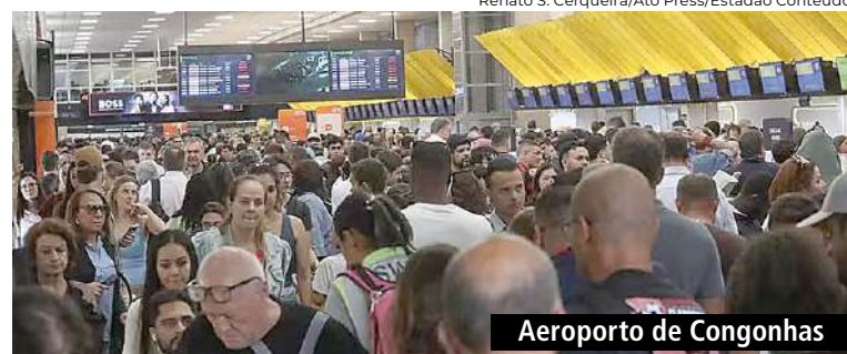
Aeroporto de Congonhas

Latam e Gol o volume de processos de responsabilização civil por atraso e cancelamento, mas as empresas redirecionaram a demanda para a Abear (Associação Brasileira das Empresas Aéreas).