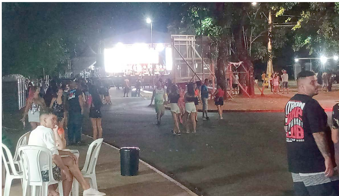
Carnaval de 2025 teve pouca adesão dos foliões

Questionada pela reportagem de O Verdadeiro, a Prefeitura informou que, desde a retomada do Carnaval, o horário das festas foi antecipado, com o encerramento da música no palco por volta das 22 horas. “A limpeza é feita diariamente após os eventos, assim como a higienização dos banheiros e o recolhimento do lixo. As festas municipais realizadas no ano passado, com exceção do Carnaval, ocorreram em frente à Igreja Matriz, na Praça da Concha Acústica e no Estádio Municipal”, diz a nota encaminhada pelo