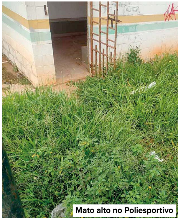
Mato alto no Poliesportivo