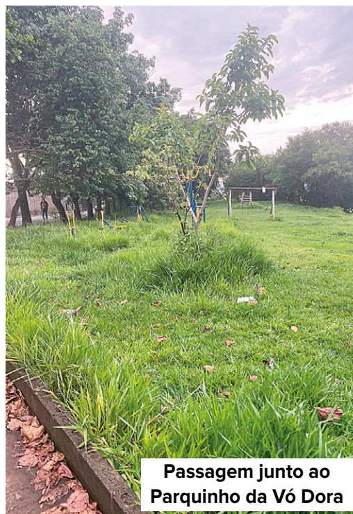
Passagem junto ao Parquinho da Vó Dora

O clima de verão, com sol, forte calor e chuva, tem feito o mato crescer rápido por Rio das Pedras. Diversas áreas verdes e de lazer estão com a vegetação alta, o que tem gerado reclamações de moradores em diversos bairros.