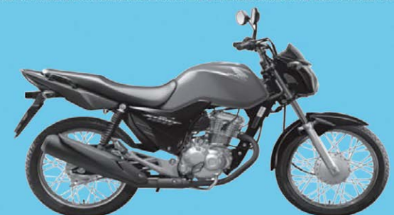
Foto meramente ilustrativa. A documentação será de responsabilidade do comprador. Se não houver sorteio, o bilhete valerá para o sábado seguinte. Obrigatório a apresentação do bilhete premiado.

Secretaria da Igreja Nossa Senhora Aparecida Rua Angelo Roncato, 725 - Bairro Sta Teresa - Fone (19) 3493-7434 Agentes das Pastorais e Integrantes do ECC