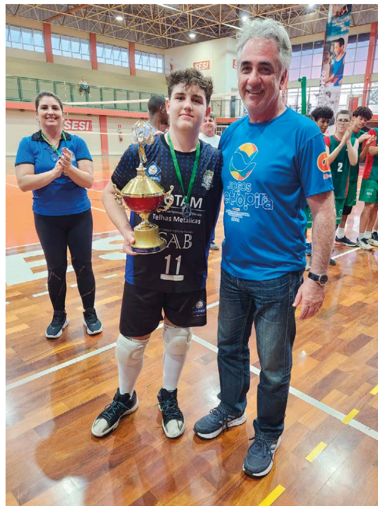
Capitão de vôlei masculino recebe troféu do secretário de Esportes de Piracicaba

No futsal feminino, disputado no Parque Prezotto, Piracicaba venceu Rio das Pedras por 2x0, o que garantiu o vice para as rio-pedrenses.