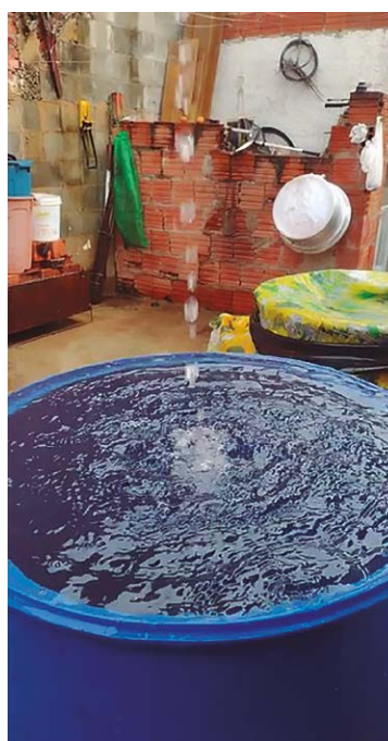
Reprodução do vídeo postado pela moradora no momento da chuva

O abastecimento de água em Rio das Pedras continua sendo assunto que causa polêmicas. Entre os questionamentos feitos pela população está quando a qualidade da água fornecida, em especial quanto a sua coloração amarelada. No dia 18 de fevereiro, o jornal O Verdadeiro publicou matéria relatando os inúmeros depoimentos, fotos e vídeos feitos por moradores evidenciando a situação.