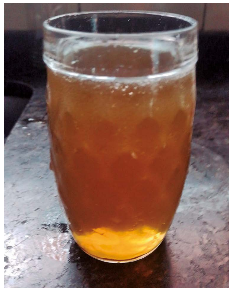
Água coletada por morador na quarta-feira (16)

Questionado nesta quinta-feira (17), o SAAE garante que a água é potável e esta de acordo com a legislação. “Porém, a condição da água pode sofrer alterações até por falta de limpeza da caixa dentro das residências”, completa a nota, afirmando que a água suja nas torneiras pode ser ocasionada por sujeira nos reservatórios residenciais.