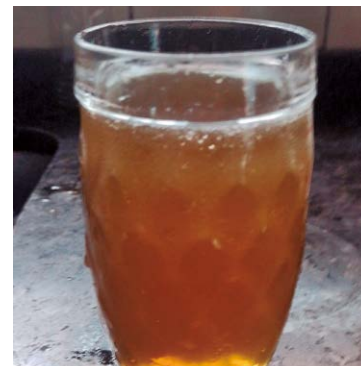
Água coletada por morador na quarta-feira (16)

minhada pela Prefeitura, a água é constantemente avaliada e as correções são feitas conforme as análises são realizadas e definem o tipo de tratamento adequado. A orientação para os consumidores que considerem a água de má qualidade é solicitar ao SAAE uma análise com coleta na residência.