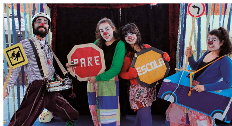
Divertida, a peça vai esmiuçando as principais regras de trânsito

Divertida e nada monótona, a peça vai esmiuçando as principais regras de trânsito que devem ser respeitadas tanto pelo motorista quanto pelo pedestre. Regras como atravessar as ruas na faixa, respeitar os semáforos e sinalizações, aguardar a pas-