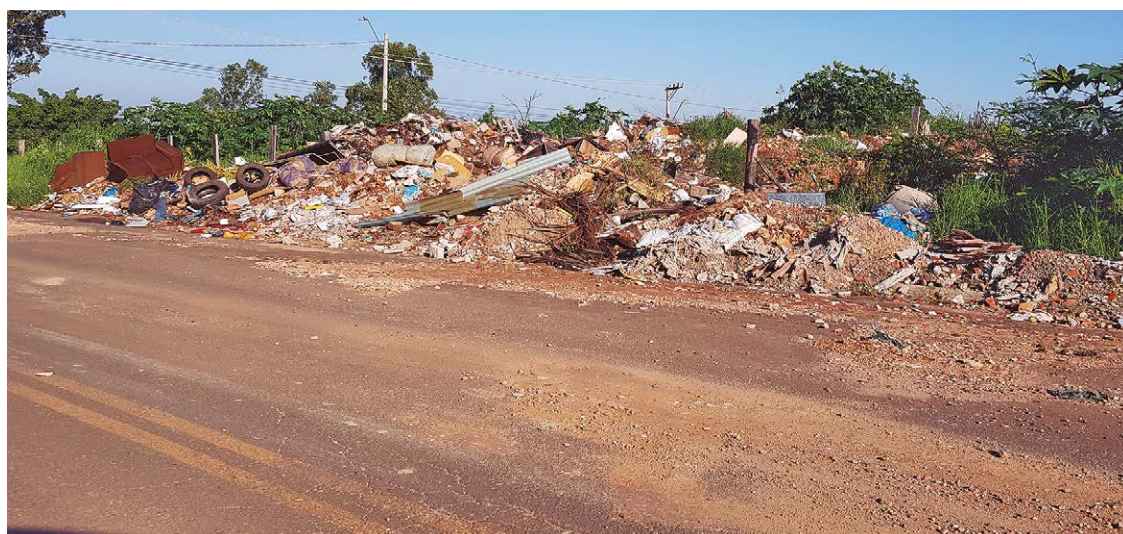
Questionada, a Prefeitura informou que não há nenhuma autorização para a área ser usada como local de descarte

se a Prefeitura fará a limpeza da área, muito menos quando o serviço será realizado e para onde o material recolhido será encaminhado.