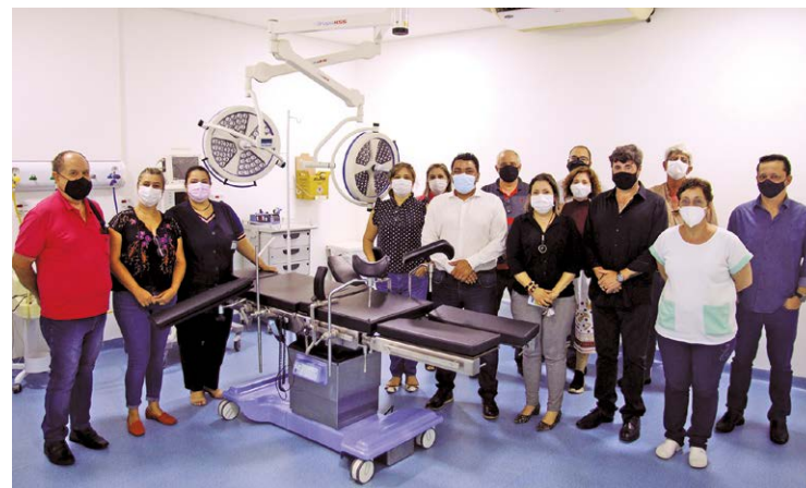
O hospital retorna com as cirurgias de pequena e média complexidade

O período em que as cirurgias eletivas ficou suspenso foi obrigatório pelo hospital em virtude do atendimento a determinação do Governo Estadual, durante o período da pandemia causada pela Covid-19. Por outro lado, a direção do hospital implantou leitos de UTI e Enfermaria exclusivos para atendimento aos pacientes