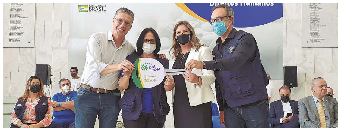
A ministra Damares Alves participou da solenidade de entrega, junto com o ministro Marcos Pontes

“É uma felicidade muito grande disponibilizar um veículo para o Conselho Tutelar, porque nós somos empregados da população e essa é mais uma conquista para Rio das Pedras, um carro para a melhora constante na qualidade de vida de nossas crianças e adolescentes”,