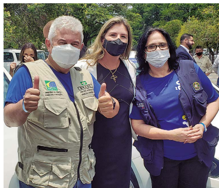
A ministra Damare Alves participou da solenidade de entrega, junto com o ministro Marcos Pontes, de Ciência, Tecnologia e Inovações