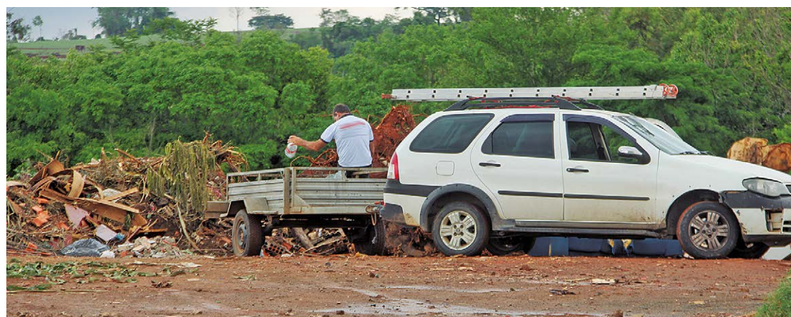
O descarte de entulho em local inadequado ocorre há muitos anos em Rio das Pedras

Um grande terreno na rua que dá acesso ao Jardim Alvorada (ainda sem nome), na esquina com a rua Cristina Taranto Paris, está recebendo montanhas de entulho e lixo. Uma rápida olhada no local é possível ver restos de material de construção, armários, sofás, fraldas e lixo doméstico. As pilhas de entulho dão indício de o descarte ser feito por