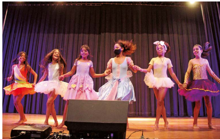
Houve apresentação de dança, canto e música com instrumentos

Houve apresentação de dança, canto e música com