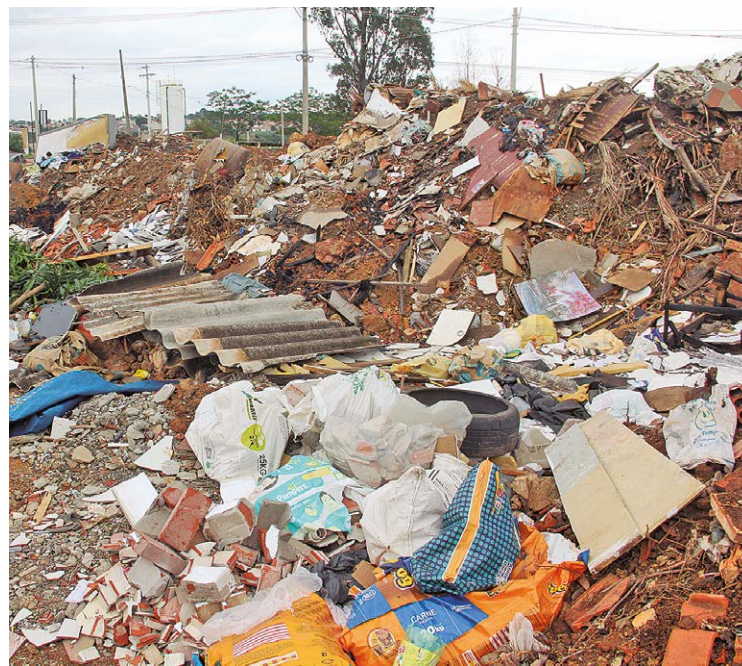
O descarte de entulho em local inadequado ocorre há muitos anos

deiro encontrou em contato com a Prefeitura para buscar informações a respeito do terreno que recebe entulho