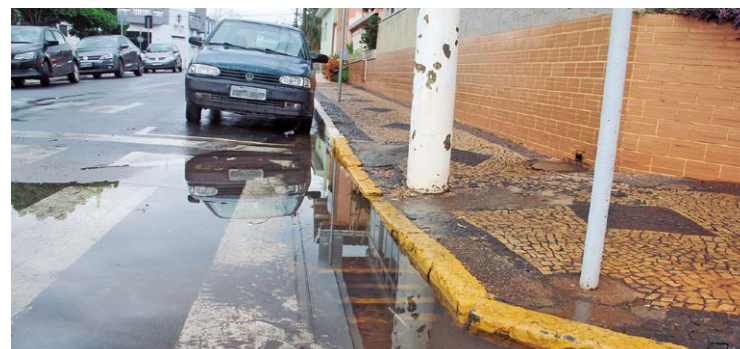
O transtorno se estende aos pedestres, que precisam passar pela água acumulada para atravessar a rua

Outros bueiros da cidade também apresentam sinais de entupimento, fazendo com que a água fique acumulada junto a