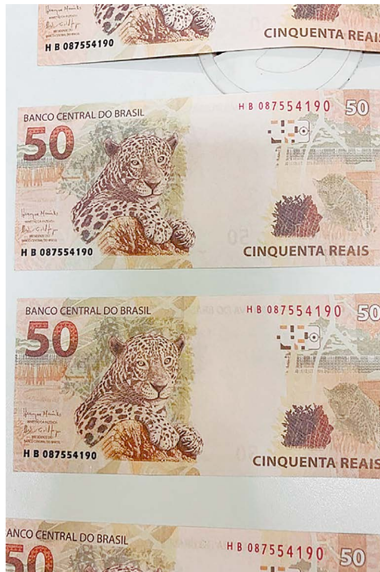
Nesta terça-feira (9), a corporação apreendeu oito cédulas falsificadas em três endereços de Rio das Pedras

A investigação agora prossegue voltada a identificar a origem das cédulas, ou seja, quem as está falsificando e distribuindo pela internet. O crime de moeda falsa, previsto no artigo 289 do Código Penal, prevê pena em de reclusão de 3 a 12 anos, e multa.