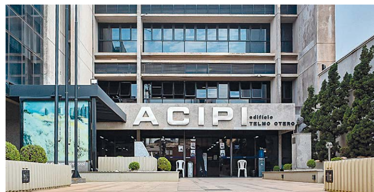
Os cursos da FAC Acipi são reconhecidos pelo MEC

Por meio das iniciativas da ACSP (Associação Comercial de