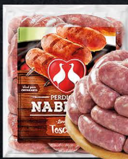
Linguíça Toscana Na Brasa Perdigão Kg