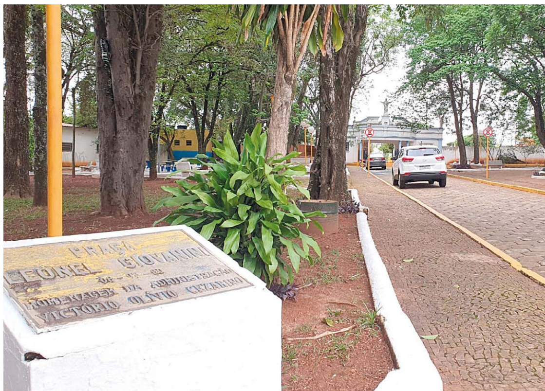
Durante o final de semana o cemitério também estará aberto para as famílias que desejaram realizar preparativos para Finados

Além dos cuidados com distanciamento social, uso de máscara e álcool em gel, é preciso redobrar os cuidados com os possíveis criadouros do mosquito Aedes aegypti , transmissor da dengue. Desde o começo do ano, Rio das Pedras já confirmou 41 casos da doença. Portanto, a recomendação é que as flores sejam levadas em vasos com terra ou em buquês, sem deixar recipientes com água ou ainda que possam acumular água.