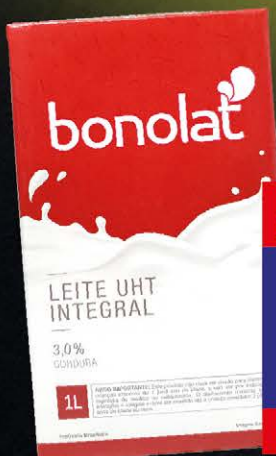
Leite Bonolat Integral TP 1 Litro