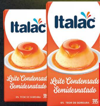
Leite Condensado Italac Semidesnatado 395g