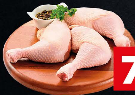
Coxa com Sobrecoxa de Frango Kg