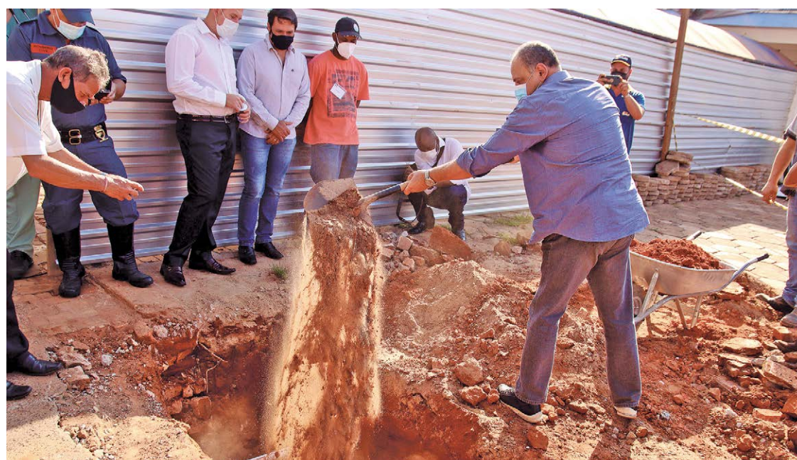
Deputado Roberto Alves enterra capsula do tempo onde será o novo Pronto Socorro

Para simbolizar a pedra fundamental foi montada uma caixa onde foram colocados jornais da cidade, região e estado, fotos do antigo Pronto Socorro e projeto do novo, assim como alguns itens sugeridos na hora, como uma máscara facial que representa o período de pandemia. A proposta é que a caixa seja desenterrada daqui 30 anos.