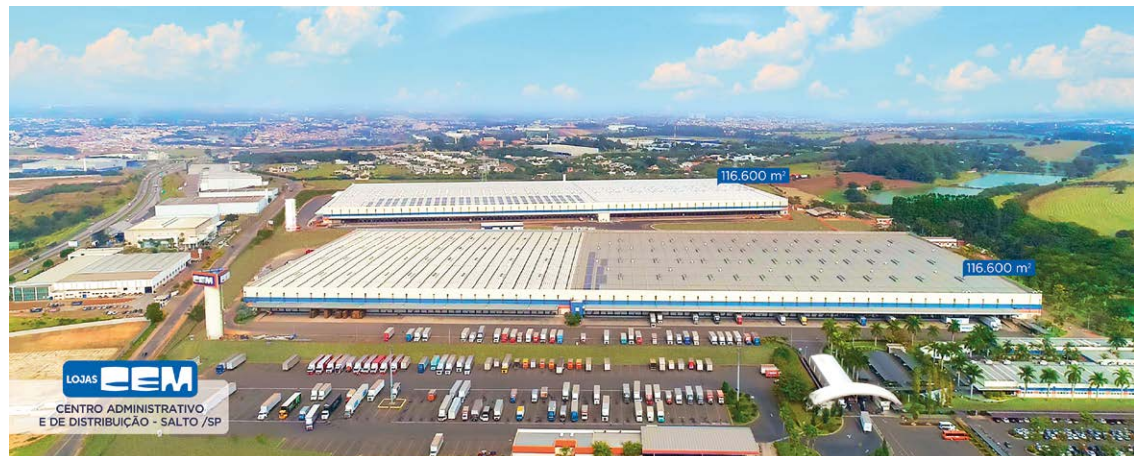
O Centro Administrativo e de Distribuição das Lojas CEM: dois depósitos com 116.600 m² cada um

Em cada cidade onde se instalam, as Lojas CEM geram cerca de 40 empregos diretos, contribuem com o desenvolvimento elevando a arrecadação de impostos, fortalecem o comércio local e oferecem novas opções de consumo à população. Além dos preços baixos, o crediário é próprio, pelo tradicional "Carnezinho", feito e aprovado nas filiais da rede, sem taxas de abertura de crédito, emissão de boletos ou anuidade.