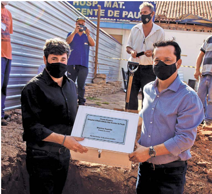
Uma cápsula do tempo enterrada junto a entrada do futuro Pronto Socorro de Rio das Pedras marcou o lançamento da pedra fundamental

Uma capsula do tempo enterrada junto a entrada do futuro Pronto Socorro de Rio das Pedras marcou o lançamento da pedra fundamental que anunciou o início das obras para a construção da unidade de saúde. As obras já tiveram início com a terraplanagem e preparação para execução da fundação do prédio. O Pronto Socorro anterior foi demolido em novembro de 2020, mas o início das obras precisou ser atrasado em virtude da pandemia do Covid-19. Durante esse período, o atendimento de urgência e emergência foi realizado em uma ala do Hospital e Maternidade São Vicente de Paulo devidamente preparada, o que seguirá sendo feito até o final das obras.