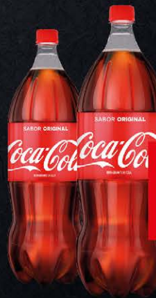
Refrigerante Coca-Cola Pet 2 Litros