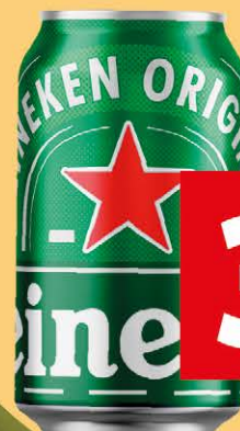
Cerveja Heineken Lata 350ml