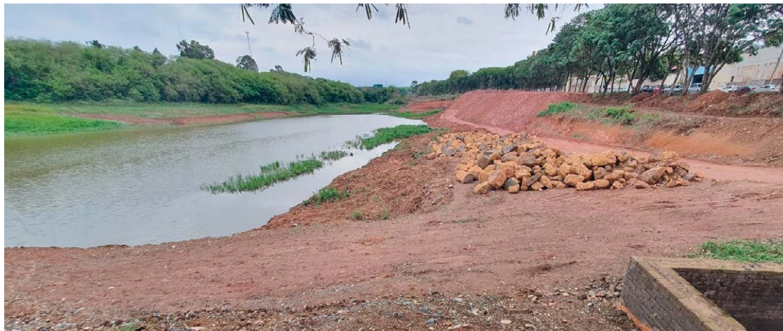
De acordo com o parlamentar, a autorização da Cetesb se estende para a limpeza das margens do reservatório dos fundos da área, próxima a fazenda