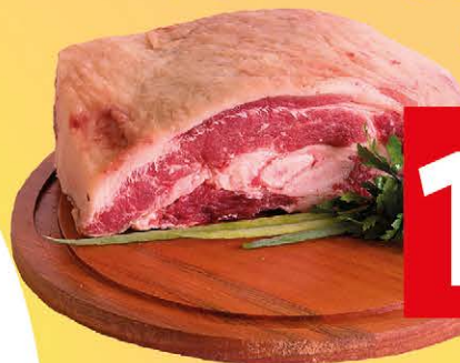
Costela Minga Bovina - Kg