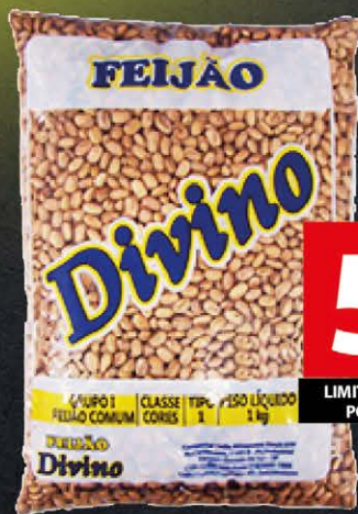
Feijão Carioca Divino 1 Kg