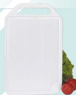
TÁBUA CARNE PLÁSTICA NITRON 31,8 X 20,7CM