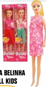
BONECA BELINHA WELL KIDS