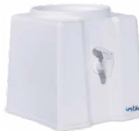
SUPORTE DE GALÃO DE PLÁSTICO