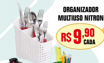
ORGANIZADOR MULTIUSO NITRON