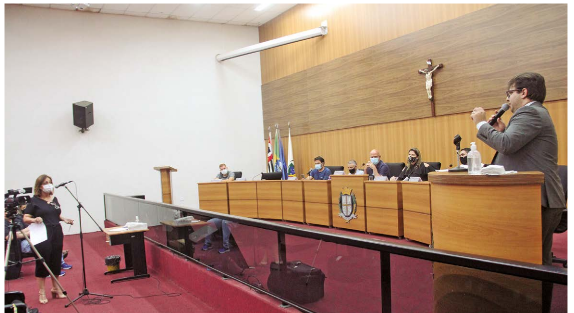
Conforme a audiência se desenrolou, mais dúvidas surgiram, como os critérios para estabelecer as isenções previstas e quem irá arcar com tais isenções

Os vereadores também participaram da audiência com perguntas, tirando dúvidas importantes para decidir a postura que irão adotar quando for momento de votar o PL.