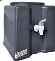
SUPORTE DE GALÃO DE PLÁSTICO