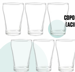
COPO CERVEJA 180ML ATACADO (ACIMA DE 6 OU + UNIDADES)