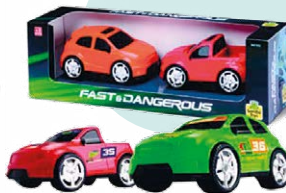
KIT FAST DANGEROUS