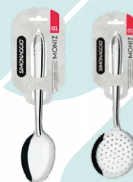
COLHER OU ESCUMADEIRA INOX SIMONAGGIO MONIZ