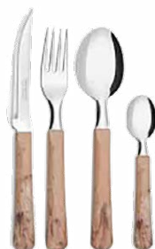
TALHER SIMONAGGIO ATACADO (ACIMA DE 6 OU + UNIDADES)