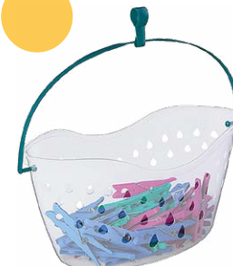
CESTO COM 48 PRENDEDORES FLASH LIMP