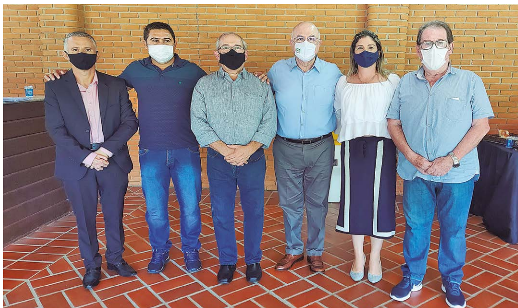
Comitiva rio-pedrense solicitou verba de R$ 400 mil que será destinada à ETEC